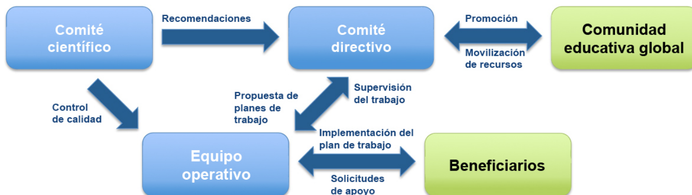
Figura 3: Estructura del gobierno institucional de A4L

Las actividades de A4L serían monitoreadas y evaluadas de acuerdo con el marco de resultados que desarrollen, y obtendrían una evaluación externa después de tres a cuatro años de operación. Tendrían como objetivo recopilar e implementar lecciones aprendidas en sus operaciones en forma regular.