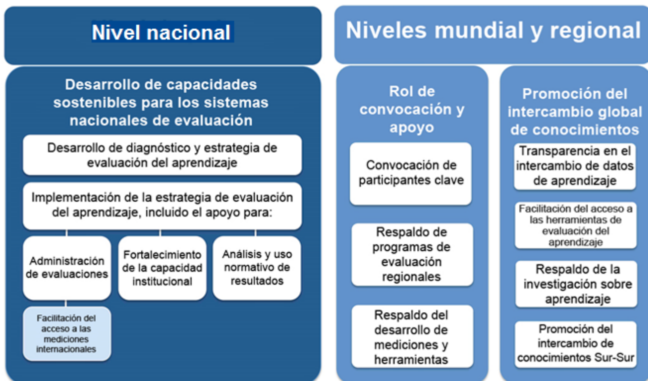
Figura 2: Descripción general de las actividades de A4L

Este apoyo se clasificaría en varias modalidades específicas, que se detallan en las páginas siguientes: